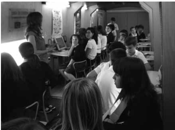
Jornada ecológica: el Ecobús.