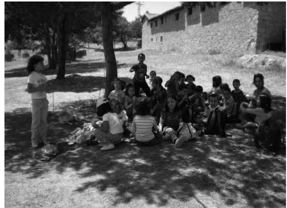
Museo Etnográfico de Huertas de Ánimas.