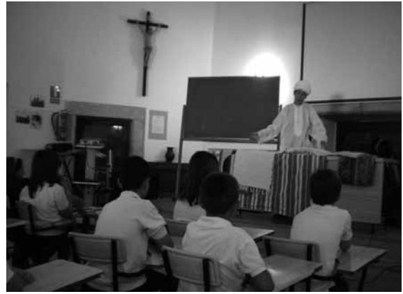
Animación a la lectura: cuentacuentos.