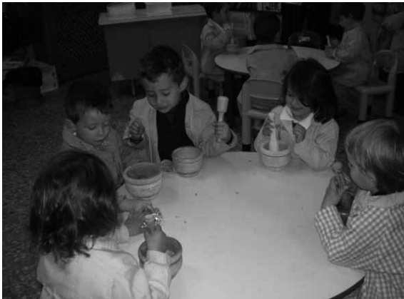
Educación Infantil: dulce jornada.